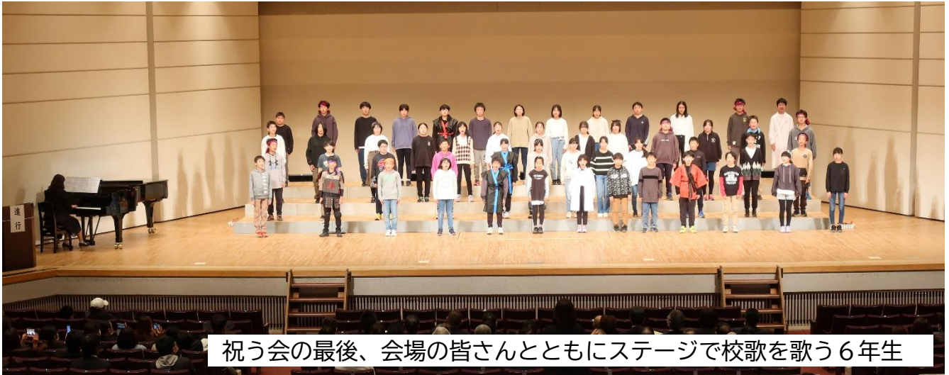
祝う会の最後、会場の皆さんとともにステージで校歌を歌う6年生

10月28日(土)、二戸市民文化会館において、福岡小学校創立150周年を祝う会を行いました。PTAが昨年度から実行委員会を立ち上げて準備を進めてきた式典の部、児童が中心となりシナリオを考えたり小道具や衣装を作ったりして練習を進めてきた児童発表の部、どちらも歴史ある福岡小学校にふさわしいものであったと思っています。