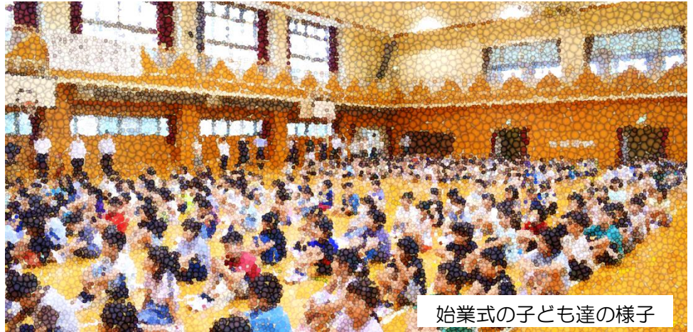
始業式の子どもの様子